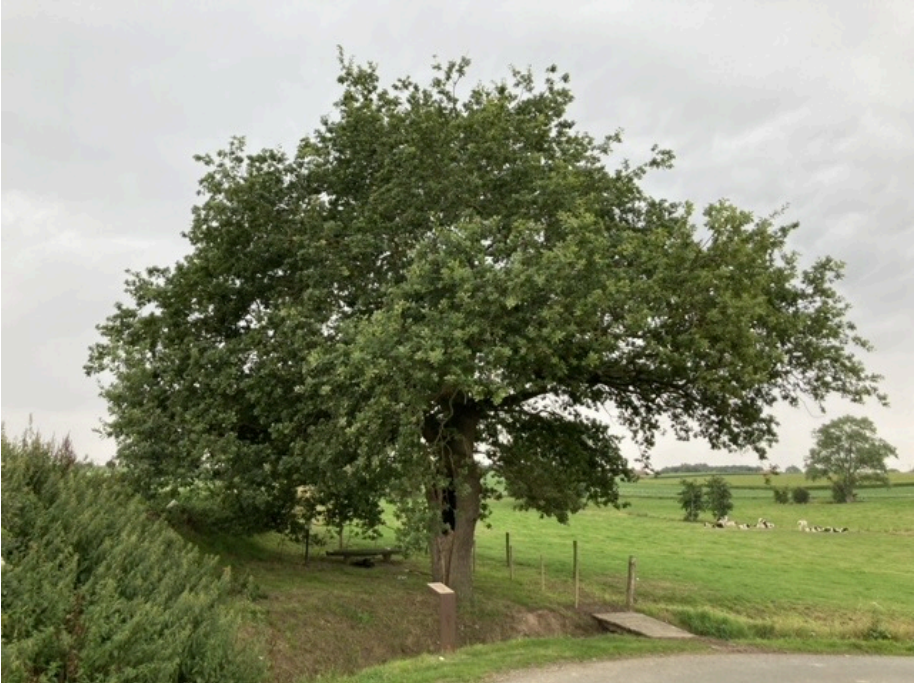
De 'Vredeseik' langs de Noordstraat te Kemmel'

Op de Kuurnse begraafplaats werd een 'Westhoekeik' aangeplant, in de buurt van de WO I oudstrijdersgraven. Dit is een nakomeling van de 'Vredeseik' die in april 1918 zwaar beschadigd werd tijdens de Slag om de Kemmelberg, maar overleefde.